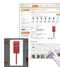
オンリーワン 商品検索サイト掲載