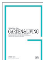
ガーデンリビング