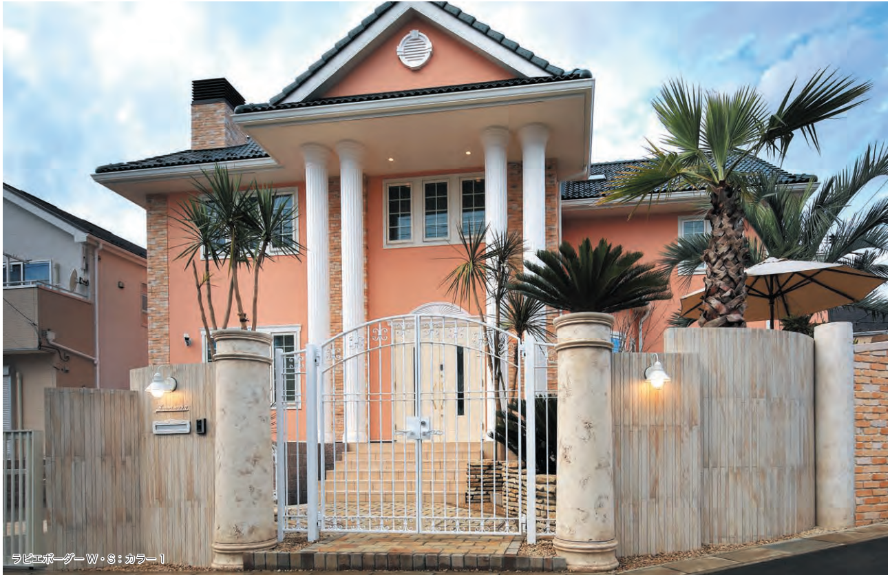
ラピエボーダー W・S: カラー1