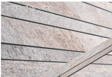
ラピエボーダー W・S: カラー1