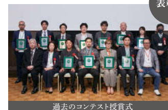
過去のコンテスト授賞式

オンリーワン大賞・優秀賞・優良賞の受賞者は、 第19期事業方針発表会にて表彰いたします。